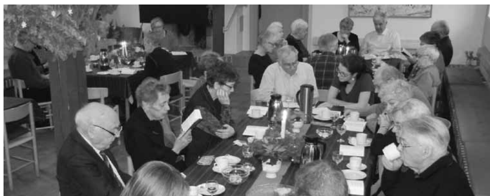
Nytårskomsammen efter Nytårsaftendags gudstjeneste den 31. december i salen

Stemning i kryptkirken under Vor Frue kirke i Århus – den ældste stenkirke i hele Norden, som fortsat står med sine mure og også i dag bruges til gudstjeneste. Både valgmenighedens store konfirmander og minikonfirmanderne har besøgt det gamle kirkerum på tur til Århus i november og december