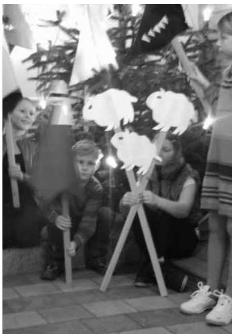
Fra Helligtrekongersgudstjenesten den 6. januar 2013.