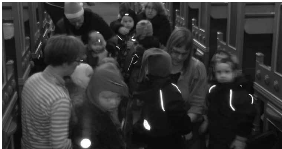
Mange små under 3 år i flyverdragter kommer i kirke i Vinderslev til Vinderslevområdets dag-plejes julegudstjeneste, som der er tradition for, at valgmenighedspræsten holder.