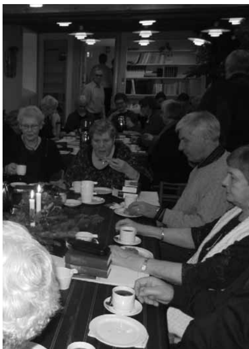
Juletoner i både Hørup kirke og i valgmenigheds sal blev nydt af ca. 50 deltagere i adventsmødet den 6. december