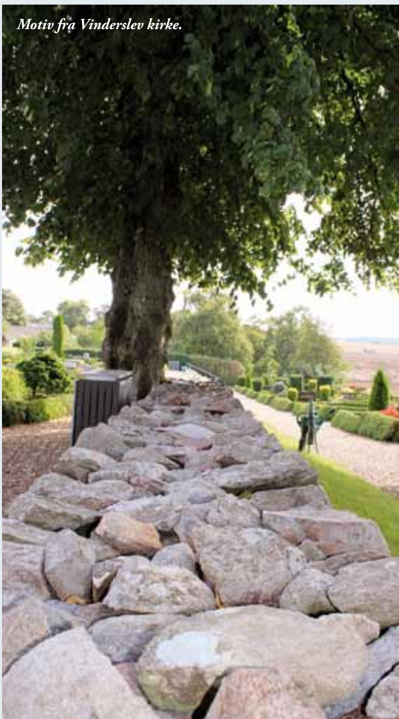
Motiv fra Vinderslev kirke.

Kirkebakken 13 • 8620 Kjellerup Tlf. 86 88 11 10 www.kjellerupvalgmenighed.dk