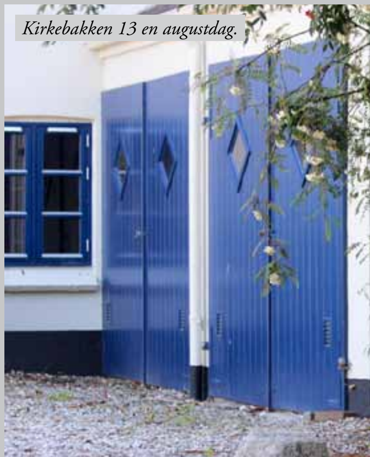
Kirkebakken 13 en augustdag.

færdes mellem to kulturer. For en voksen er kulturforskelle lettere at forholde sig til, men det er også her, man får et alvorligt ansvar for at vælge mellem to kulturer. Foredraget vil handle om den personlige kamp mellem to kulturer og om sidenhen at skulle skelne venner fra fjender i det politiske landskab, hvilket skaber konflikter i både den iranske og den danske lejr.