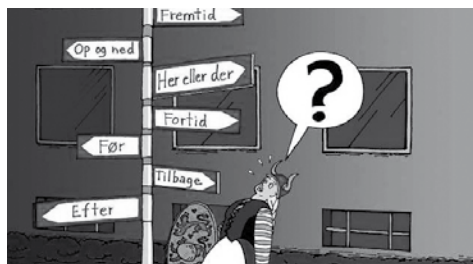
Tegning: Anne-Marie Steen Petersen.

Vi har tre slags sprog til at tale om livet og verden: Videnskabens rationelle og teoretiske sprog om naturen, religionens tydningsprog om livets mening og kunstens æstetiske sprog om følelserne, de uudsigelige erfaringer og intuitive sandheder .