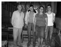
Frivillige i voksenkoret i Nim.

”Som frivillig er man ikke forpligtet. Man modtager salmenumrene midt i ugen på mail, og møder bare op en halv time før gudstjenesten og øver salmerne med organisten. Kom og vær med, hvis du har en god sangstemme”.